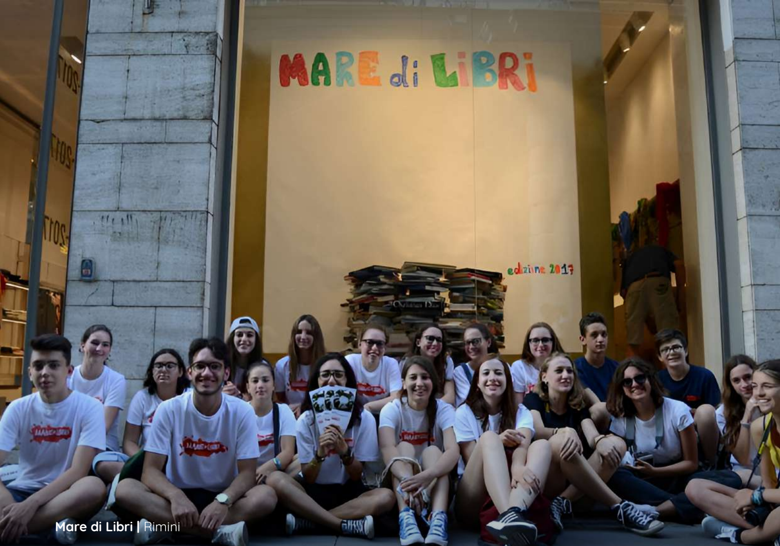
Mare di Libri | Rimini