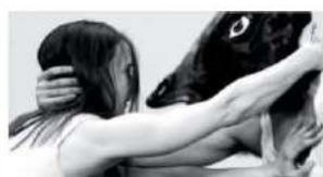
▲ Hold Your Horses

"Hold Your Horses", idioma inglese mutuato dal mondo dell'equitazione che sta per "rallenta", parla dell'impulso di aggrapparsi a qualcosa o qualcuno. «Dopo 18 mesi di distanza, quando anche una stretta di mano era sospetta, qual-